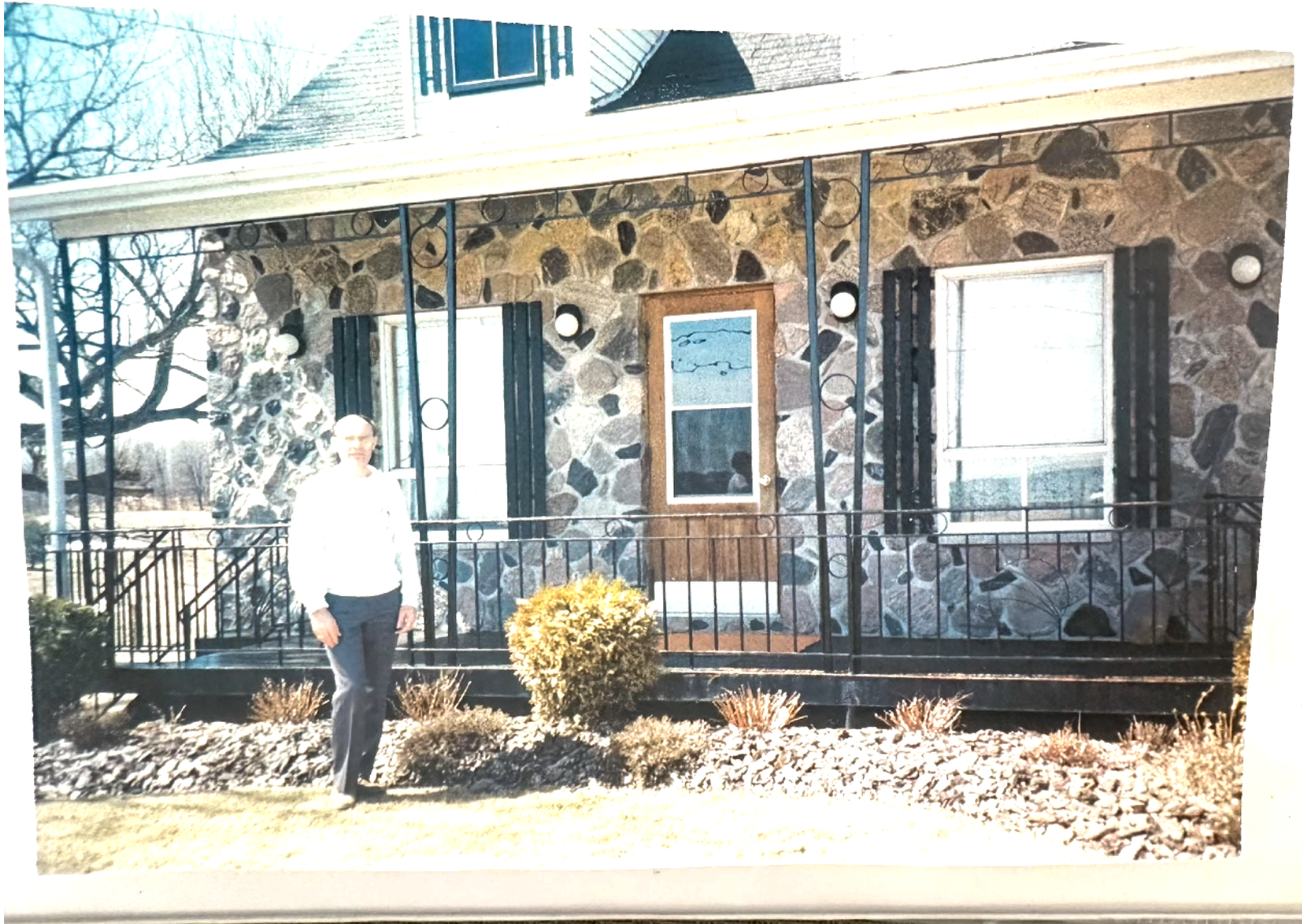
La vie à la maison familiale