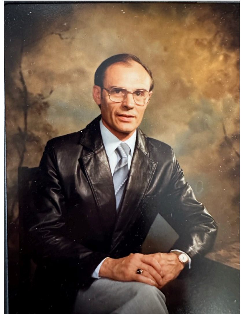
Une photo d'Adéodat Bernard par Germain Pilon